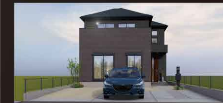
※イメージパースにつき実際とは多少異なる場合がございます。