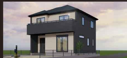
※イメージパースにつき実際とは多少異なる場合がございます。