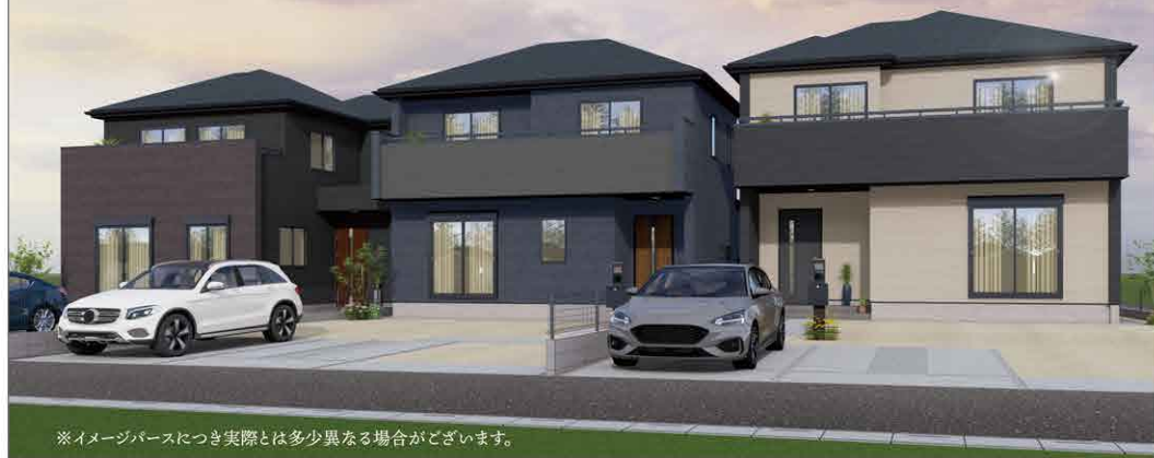
※イメージパースにつき実際とは多少異なる場合がございます。

JR高崎線「北本」駅徒歩 23分 コンビニ 3分 、ドラッグストア 5分 、 スーパー 7分 など恵まれたロケーション