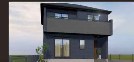
※イメージパースにつき実際とは多少異なる場合がございます。