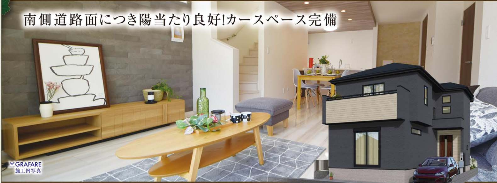
※イメージパースにつき実際とは多少異なる場合がございます。