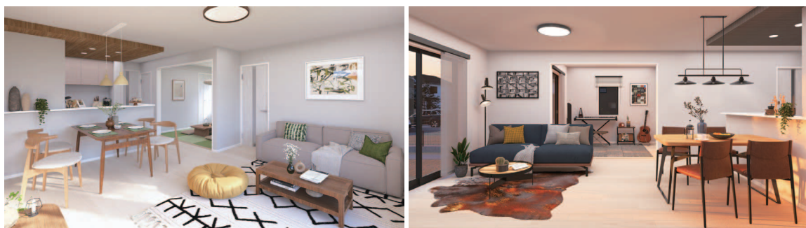
内観イメージパース

【物件概要】●所在地 / 埼玉県羽生市北3丁目5-34、5-31 ●交通 / 東武伊勢崎線「羽生」駅まで徒歩16分 ●構造 / 木造2階建 ●接道 / 南側7.87m公道 ●土地権利 / 所有権 ●地目 / 畑 ●用途 / 第1種中高層住居専用地域 ●都市計画 / 市街化区域 ●建ぺい率 / 60% ●容積率 / 200% ●設備 / 公営水道、プロパンガス、本下水 ●備考 / 景観法 ●完成 / 2024年6月予定 (3号棟) ●引渡 / 相談 ※TVアンテナ(電波障害によるケーブルTV、共聴アンテナの申込はお客様の負担となります。) 網戸、照明器具、カーテンレール、面格子は付きません。 ※網戸一式別途154,000円(税込) ※図面と現況に相違がある場合は現況を優先とします。 ※電気供給の敷地内に電柱及び支線が入る場合があります。 ※当社指定の司法書士・家屋調査士(表題登記費用93,500円/税込)を利用させていただきます。 ※フラット35S利用の場合、別途手数料93,500円が発生いたします。(金利タイプAプラン)